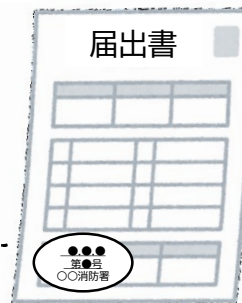
届出書の副本 (消防署の登録印付き)