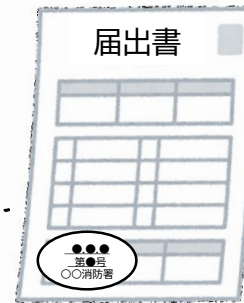
届出書の副本 (消防署の登録印付き)