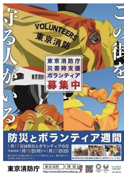
防災とボランティア週間ポスター

そのため、東京消防庁災害時支援ボランティア（以下「災害時支援ボランティア」という。）の制度の周知、登録促進を図るとともに、活動能力の強化に努め、より一層の地域防災力の向上に取り組んでいます。