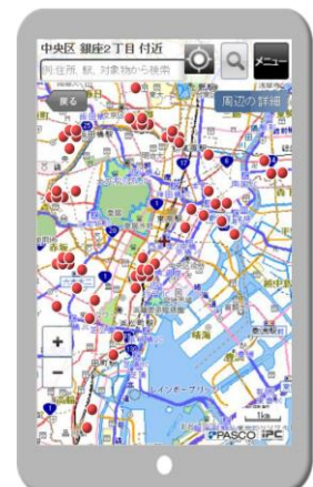
スマートフォン版