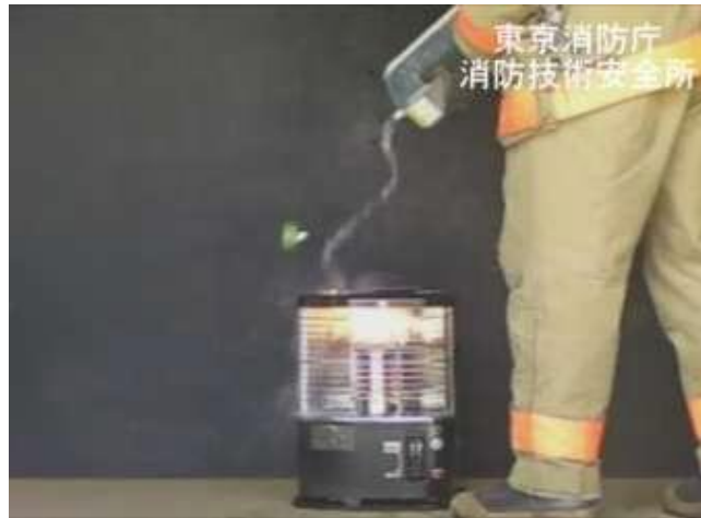
カートリッジタンクから灯油がこぼれた状況