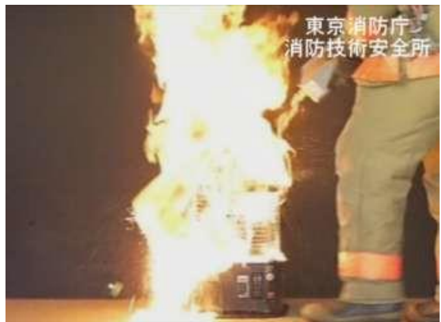
石油ストーブの火が灯油に引火した状況